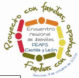
Participación por provincias