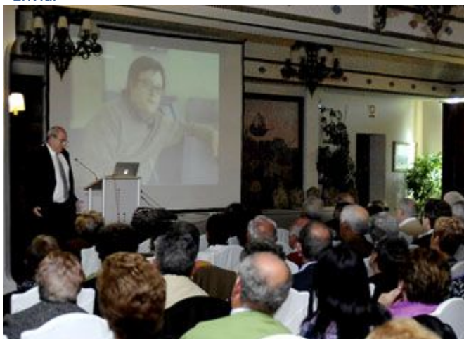
Los participantes, en una de las sesiones de trabajo celebradas ayer en el Hotel Cándido.

Cerca de 400 personas procedentes de todos los puntos de la región participaron ayer en el Encuentro de Familias de personas con discapacidad intelectual convocado por FEAPS Castilla y León con el objetivo de poner en común la experiencia de convivencia de los núcleos familiares con personas discapacitadas a su cargo.